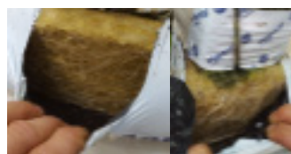
Concombre hors sol