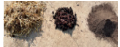
Lombricompostage de fumiers équins