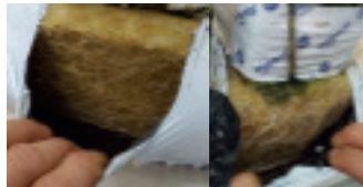
Concombre hors sol