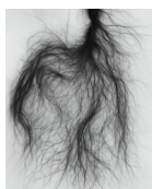
Eden Sol Liq'