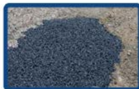
Nids de poule