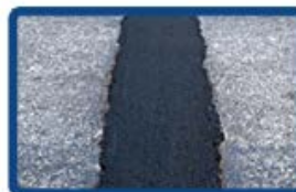
Tranchées et raccords