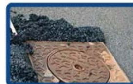
Mise à la cote de regards de voirie