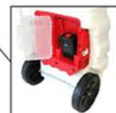
EMPLACEMENT BATTERIE Coffret avec porte protégeant des chocs et des éclaboussures