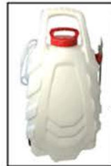
RESERVOIR Capacité de 28 litres Matière : PE