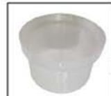
TAMIS FILTRANT Amovible et facile à nettoyer