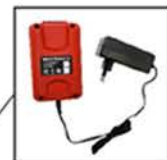
CHARGEUR + BATTERIE Secteur 220V