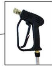
POIGNEE DE PULVERISATION 280 bar – 25 L/min – 150°C