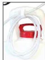
ATTACHE TUYAU VELCRO Facilite le rangement du tuyau