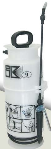
PULVE II MA015