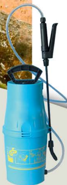
PULVE I MA010