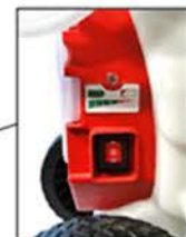
INTERRUPTEUR 3 POSITIONS 1 – Grand débit 0 – Stop 2 – Petit débit Avec témoin lumineux de charge batterie