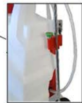
PORTE LANCE Permet le rangement de la lance et des buses