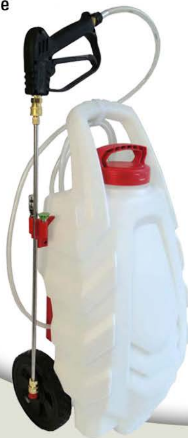
PULVÉ ÉLECTRIQUE PRO MA176