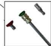
BUSES DE PULVERISATION Montage par coupleur rapide