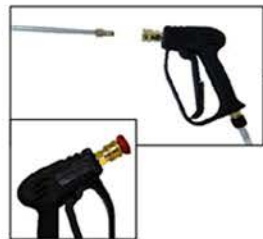
POIGNEE ET LANCE DE PULVERISATION Montage par coupleur rapide